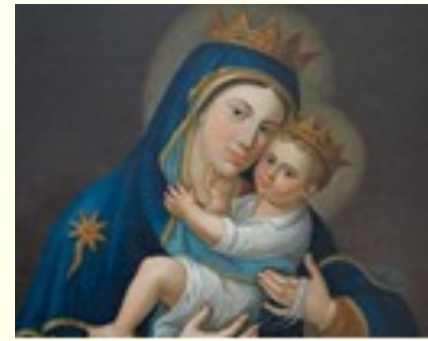
Confraternita del Gonfalone Madonna del Carmine - Celano

L'Associazione Corale Polifonica "Giuseppe Corsi" con il Patrocinio della Città di Celano con la Confraternita del Gonfalone Madonna del Carmine