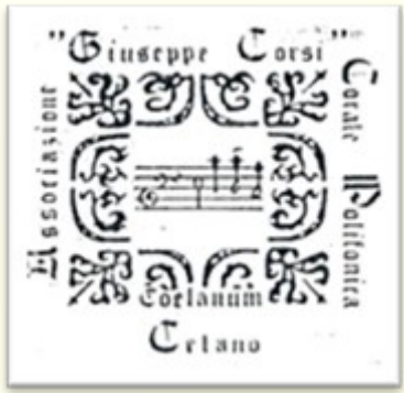
Associazione Corale Polifonica "Giuseppe Corsi" - Celano